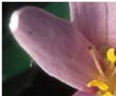
Colchique des Alpes

9. En tant que pays alpin, la Suisse est responsable des animaux habitant dans les Alpes. Les photos ci-dessous sont des détails de photos d'animaux et de végétaux alpins. De quelles espèces s'agit-il ?