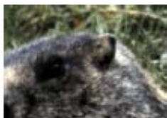
Marmotte des Alpes